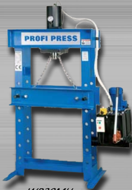
WP30MH WP60MH Elektrohydraulisch