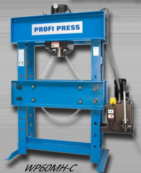
WP60MH-C WP100MH-C Elektrohydraulisch mit verstellbarem Zylinder